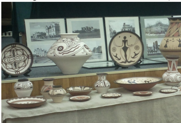
Fig. 1. Vase cu simboluri cucuteniene.

Reprezentarea scenelor cu figuri feminine, ce dansează cu mâinile ridicate, ne comunică nonverbal despre ritualurile neolitice de fertilitate. Se presupune, că se alegeau câteva femei pentru a efectua acest dans ritualic de chemare a ploii. Un alt simbol al fertilității, ce reprezintă câmpul însămânțat, este romb, împărțit în patru. Iar în fiecare cadran, este câte un punct, ce semnifică semințele sădite în pământ, viitoarea roadă. Acest simbol adesea este reprezentat pe burta figurinelor feminine, acolo, unde ia naștere o nouă viață. Câmpul este egalat cu femeia: câmpul dă roadă, iar femeia - o nouă viață, și una, și alta continuă viața. De asemenea, este vorba de un mister religios, căci doar femeile cunosc misterul creației.