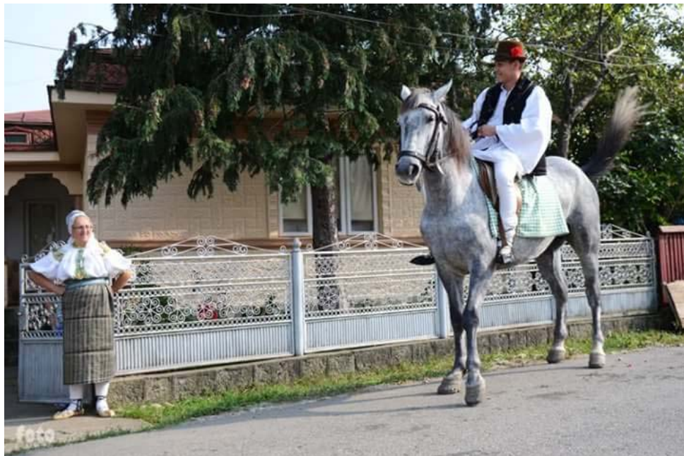
Fig. 2.3. Călăraș, invitând la nuntă.