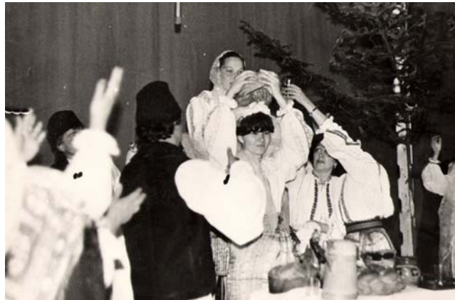
Fig. 2.6. Aruncarea colacului – fragment din spectacolul ansamblului Nunta sovejană.

Petrecerea continua luni cu „danțul”. Mirele și cu mireasa făceau o vizită nașilor, cărora le duceau un dar în obiecte de valoare, cât și socrilor mici, iar la plecarea invitau pe aceștia la socrul mare unde avea loc petrecerea și