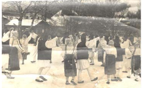
Fig. 2.9. Suita de dansuri populare sovejenești, la nuntă „De dorul”.