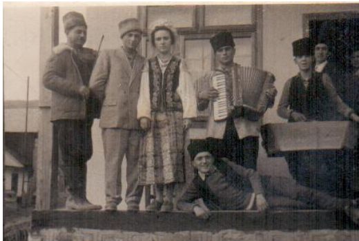
Fig. 2.7. Mirii cu taraful de lăutari.

Mireasa era dată în primire soacrei mari, iar ceilalți nuntași mergeau la casele lor, urmând a reveni seara la petrecerea de nuntă, ce se făcea cu joc și masă la socru mare, la socru mic și la nuni, doar numai joc. La miezul nopții, după înțelgerea ce se făcea cu nașii, mirele mergea la naș, iar nașul cu alaiul lui veneau la socru mare unde avea loc masa mare a nunții, urmată de dar. La masă se așezau toți „cum li-s anii/ cum li-i rangul”. Spre ziuă veneau și socrii mici cu un mic alai, aducând darul pe care îl dădeau miresei.