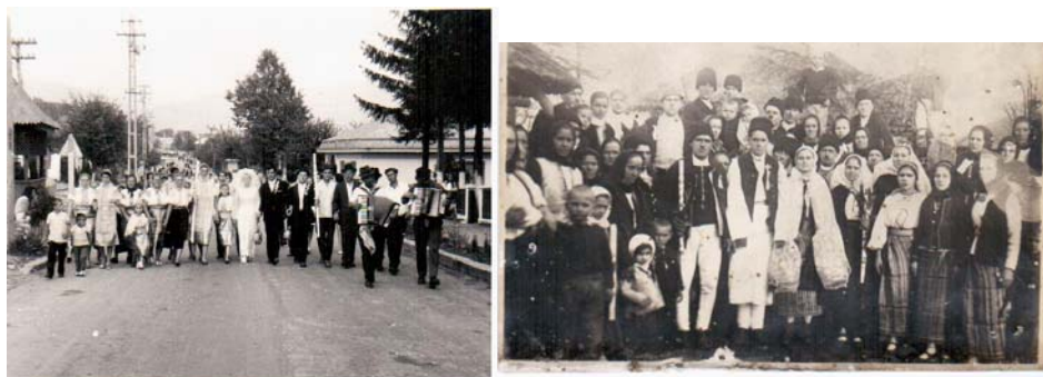
Fig. 2.4. Alaiuri de nuntă

„Colocoșenia” se încheie cu invitația către socru să închine din: „Acea butușină uscată/ lată și la mijloc crăcănătă” (plosca de vin) și cu urarea „Noroc și bine v-am găsit sănătoși”.