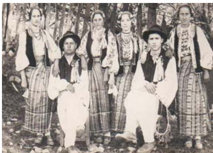
Fig. 2.8. Secvențe sovejene.