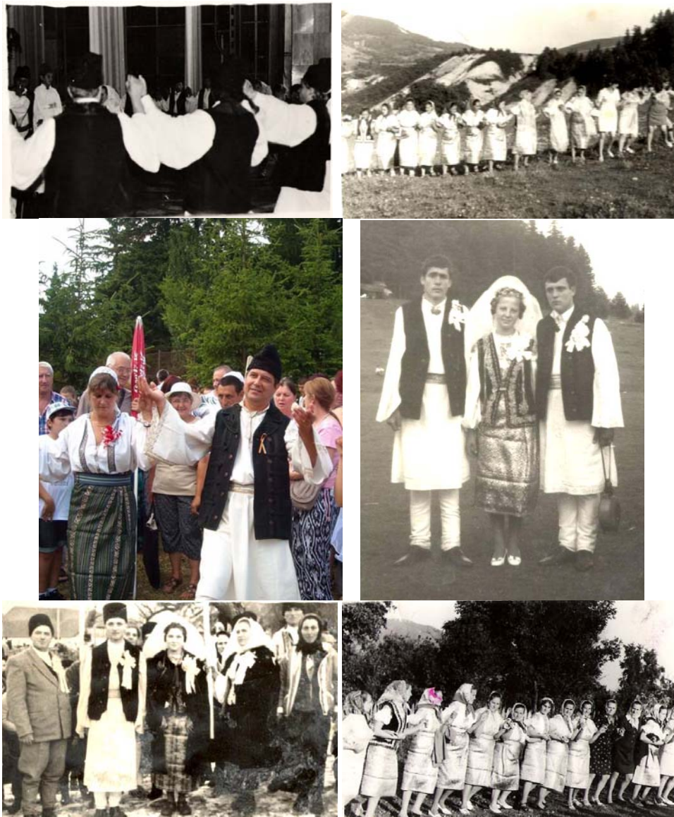
Fig. 2.5. Hora mare a nunții sovejene.

să ia ce a pus pe o pâine făcută special în casă, repetând de două ori acest lucru. A treia oară, la comanda bătrânului, fiecare lua ce apuca. De regulă, fata lua și batista și banii, simbol al spiritului gospodăresc de care avea să dea dovadă în viață. Se ura sănătate și viață lungă mirilor, iar lăutarul dădea semnalul plecării la hora mare a nunții care, de regulă, se făcea pe un loc mai deschis, pe deal, acolo unde era loc mai mult ca să poată intra tot alaiul în horă (fig. 2.5).