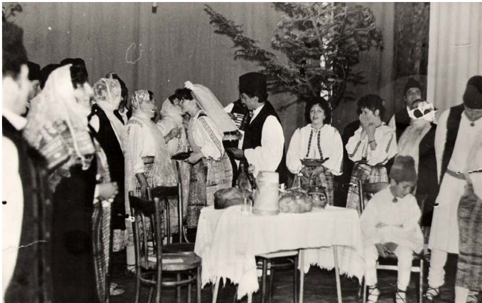
Fig. 2.5. Iertăciunea miresei (fragment din spectacolul Ansamblului Nunta sovejană).

La terminarea horei, fratele miresei lua mireasa și o ducea în casă, acesta cinstea părinții cu vin, sărutându-le mâna, luându-și rămas bun de la aceștia. Lăutarii cântau: