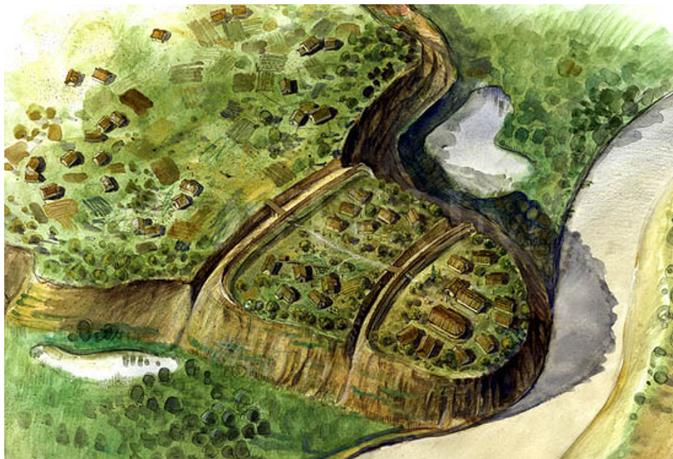
Fig. 1.5. Locul posibil de amplasare al Poesta Davei.

Amplasarea localității Poesta Dava la Popești pe Argeș ar corespunde cu unele informații cunoscute din tăblicele de la Sinaia dar și cu vestigiile arheologice