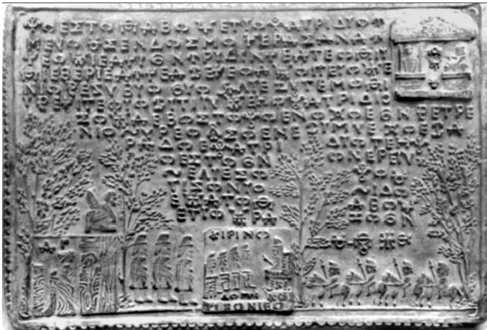
Fig. 1.3. Placuța 72. Poesta Dava lui Kotysonio și locul de naștere a lui Apolo.

Dacă în tăblițele de la Sinaia sunt relatări relativ puține despre Apolo, în schimb, despre Poesta Dava, care este locul lui de naștere, după cum rezultă din tăblița 35, acestea sunt mult mai numeroase. Astfel, tăblița 72, figura 3, este dedicată exclusiv acestei localități.