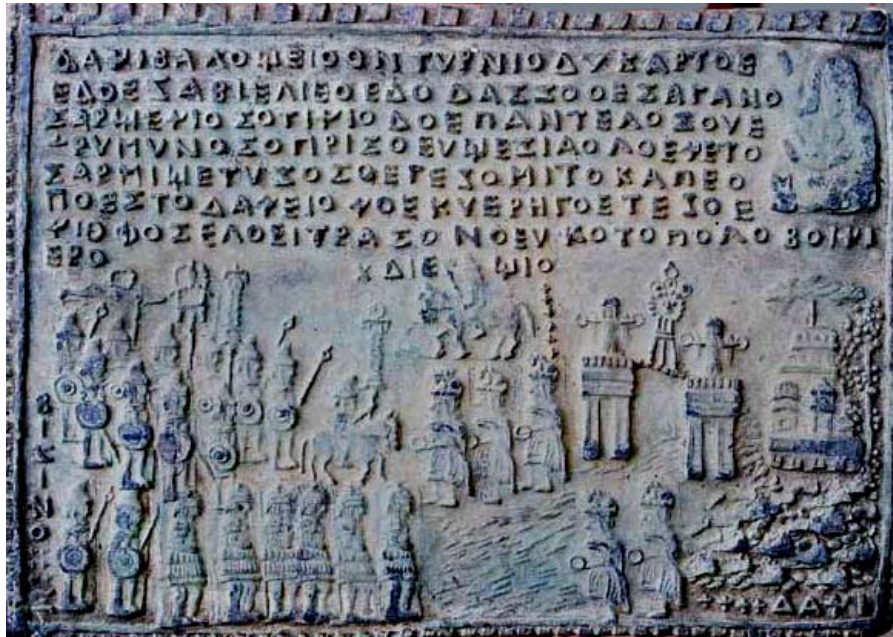
Fig. 1.4. Tablita 65. Numirea lui Diegio ca mare preot la Poesta Dava.

Alte informații sunt conținute în tăblița 65 (figura 1.4) care se referă la numirea lui Diegio mare preot la Poesta Dava în timpul domniei lui Decebal. Placa are conținutul prezentat mai jos: