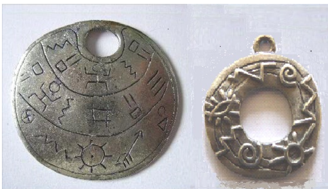
Fig. 1.1. Medalion metalic cu scriere danubiană realizată prin imprimare și unul cu scriere în relief din zona Bacău.

presupune o bună cunoaștere a modului de lucru cu materialele utilizate și a proprietăților lor. Medalionul din partea stângă are dimensiuni cuprinse între 51 și 53,7 mm și o grosime variabilă cuprinsă între 1,5 și 2,15 mm, iar greutatea de 33,3 grame și este realizat dintr-un aliaj pe bază de nichel care mai are în compoziția sa