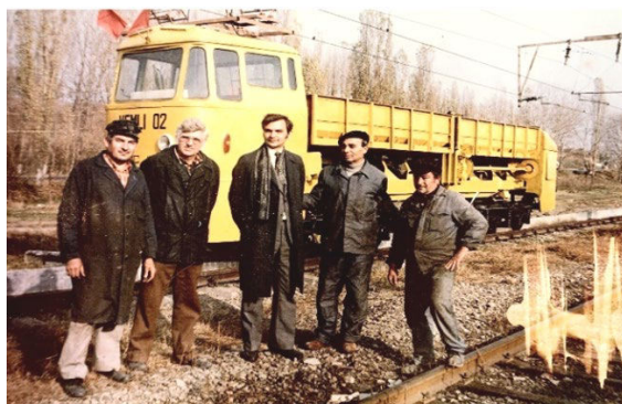
Fig. 3. Din activitatea de realizare a vehiculului cu motor liniar VEMLI-02.

Realizarea experimentării din cadrul Intreprinderii de Transport Iași-I.T.I și a activității în cadrul contractual al CCSIT-Electroputere Craiova au dus la acumularea unei experiențe importante și la validarea unor soluții deja folosite. In consecință, colectivul ieșean, reunit sub denumirea GRUMOLIN - Grup motor liniar, a început o activitate de prospectare a unor beneficiari pentru sistemul de transport deja realizat, sistem care contura o serie de avantaje sigure. Printre beneficiari s-a numărat Întreprinderea de Materiale de Construcții din Iași (I.M.C.), care dorea să înlocuiască transportul argilei din dealul Vlădicenilor la Fabrica de Cărămizi, transport care se realiza cu autobasculante pe o distanță de 1,3 km și care ridica probleme de combustibil scump și de disciplină a șoferilor. Ideea de a înlocui toate basculantele consumatoare de motorină cu un singur vehicul acționat electric era foarte atractivă. În consecință, s-a realizat un studiu de oportunitate și fezabilitate,