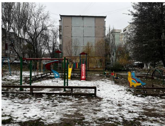
Imaginea 3. Teren de joacă, Chișinău

În acest articol am luat inițiativa de a îmbunătăți un teren de joacă local din Chișinău (imag.2), transformându-l (imag.3, imag.4) într-un spațiu captivant și sigur pentru copii, bazat pe povestea „Pungața cu doi bani” pentru crearea unui spațiu distractiv. Conștienți de importanța mediului în care copiii își petrec timpul, am propus schimbări vizuale menite să inspire și să aducă bucurie. Prin utilizarea materialelor sigure și inovatoare, împreună cu o paletă de culori vibrantă, dorim să oferim celor mici o experiență de joacă plină de imaginație și siguranță. Această inițiativă reprezintă un angajament față de dezvoltarea armonioasă a comunității și promovarea unui spațiu care să încurajeze creativitatea și să ofere bucurie fiecărui copil.