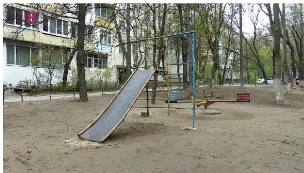
Imaginea 2. Topogan ruginit

Propunem pentru a gestiona aceste probleme, efectuarea întreținerii regulate a terenurilor de joacă, inclusiv verificării periodice pentru a identifica și repara zonele afectate de rugina sau alte deteriorări. Înlocuirea echipamentelor metalice afectate sau tratamentul acestora pentru a preveni rugina sunt măsuri importante pentru asigurarea siguranței copiilor.