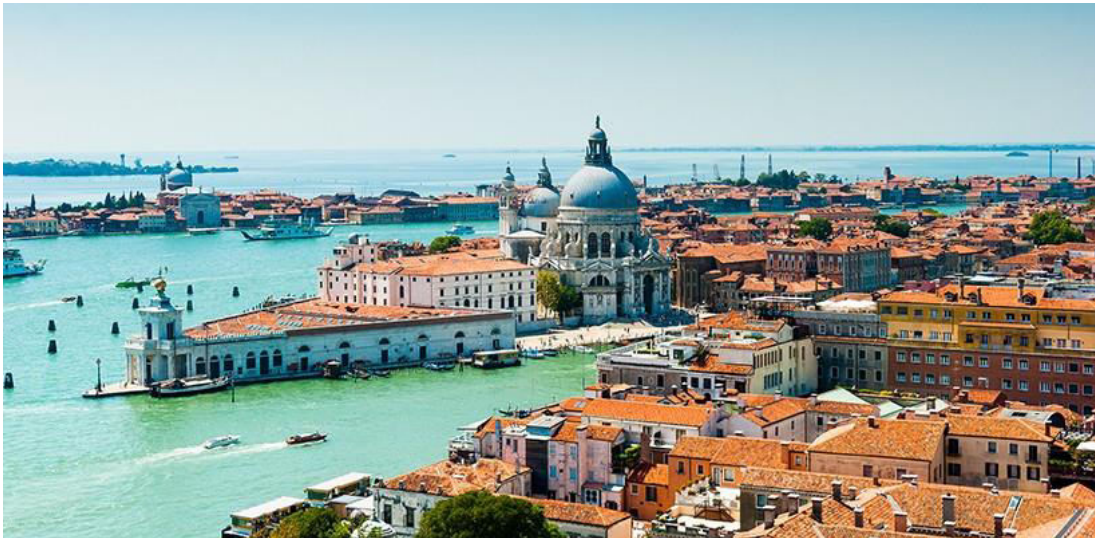
Figura 5. Amenajarea spațiilor în Florența [1]