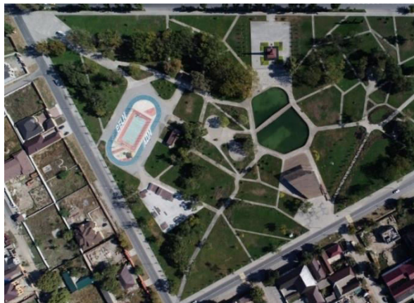
Figura 1. Amenajarea spațiului [9]