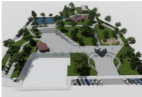
Figura 2. Amenajarea parcului [8]