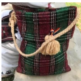
Figura 1: Traiste [3]