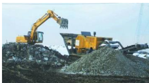
Figura 3. Exempu încărcarea deșeurilor