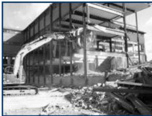
Figura 1. Exempu de deșuri construcții

Deșeurile din construcții și demolări reprezintă deșeurile rezultate din activități precum construcția de clădiri și obiective de infrastructură, construcția și întreținerea căilor rutiere, demolarea totală sau parțială a clădirilor sau a obiectivelor de infrastructură, care includ: materiale rezultate din construcții și demolarea clădirilor – ciment, cărămizi, țigle, ceramică, roci, ipsos, plastic, metal, fontă, lemn, sticlă, resturi de tâmplărie, cabluri, soluții de lăcuit/vopsit/izolante, materiale de construcții cu termen de valabilitate expirat, Fig. 1.