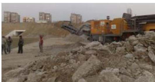
Figura 2. Exempu unui concasor pe șantier

Folosirea agregatelor reciclate cu caracteristici superioare, pentru producerea a noi tipuri de betoane a fost într-o mare măsură limitată până în prezent, deși reglementările tehnice relevante sunt disponibile [4]. Pregătirea pentru reutilizare, reciclare și alte operațiuni de valorificare materială pentru a înlocui alte materiale a deșeurilor nepericuloase provenite din activități de construcție și demolări este o etapă foarte importantă și care nu ar trebui neglijată. În cazul când sortarea se face direct pe șantier este nevoie de prezența unui concasor Fig.2., echipament pentru încărcarea deșeurilor Fig. 3. și în final obținem acele materiale reciclate care pot fi utilizate în continuare în procesul de mărunțire Fig. 4.