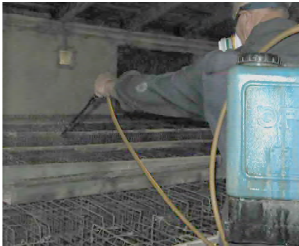
Рисунок 2. Обработка технологического оборудования птичника инсектицидом