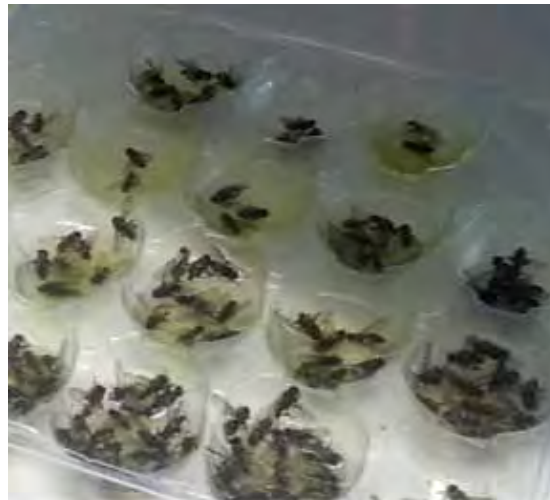
Рисунок 3. Отобранные в птичниках мертвые имаго мух после инсектицидной обработки

было предложено введение препарата на основе цифлутрина, как для проведения деларвации мест выплода мух, так и для инсектицидных обработок внутри помещений.