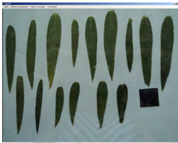
Рисунок 1. Фотоизображения тестовой выборки

Затем выделяем контуры отдельных объектов и убираем «шумы» - объекты с существенно меньшей и существенно большей площадью (рис. 3).