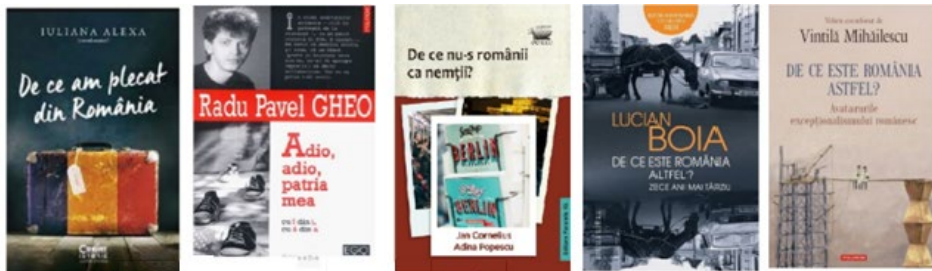
Fig. 2. Câteva dintre cărțile în care sunt abordate inclusiv probleme referitoare la plecarea românilor din țară.

stabilească în alte țări [1]. Aceste motive sunt destul de variate, dar pot constitui un punct esențial de plecare pentru analiza considerațiilor autorilor incluse în această lucrare.