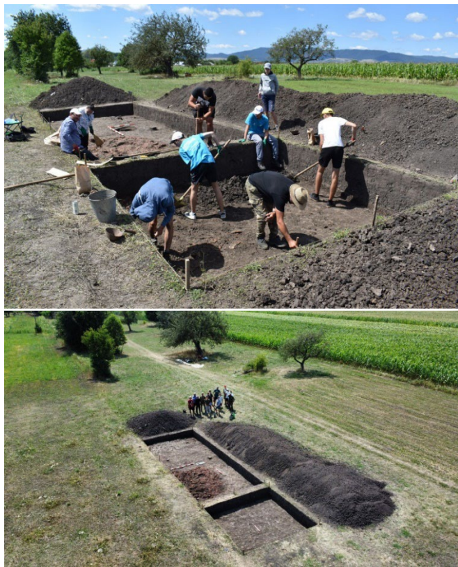
Fig. 4. Șantierul arheologic de la Topolița.

Cercetările minuțioase de până acum au arătat că respectivele comunități s-au stabilit aici pentru că au găsit un teren favorabil agriculturii, existau surse bogate de apă, iar la numai câțiva kilometri se găseau surse importante de sare. Șantierul arheologic de la Topolița (fig. 4) îi atrage, în ultimii ani, pe tinerii, care vor să