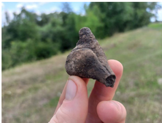
Fig. 3. Impresionanta figurină feminină.

s-au alăturat tineri inimoși, care au dorit să sprijine prin efortul lor un demers științific important. Se estimează că resturile locuinței cercetate în acest an fac parte din cele peste 20 de construcții, care alcătuiau un mic sat preistoric acum mai bine de