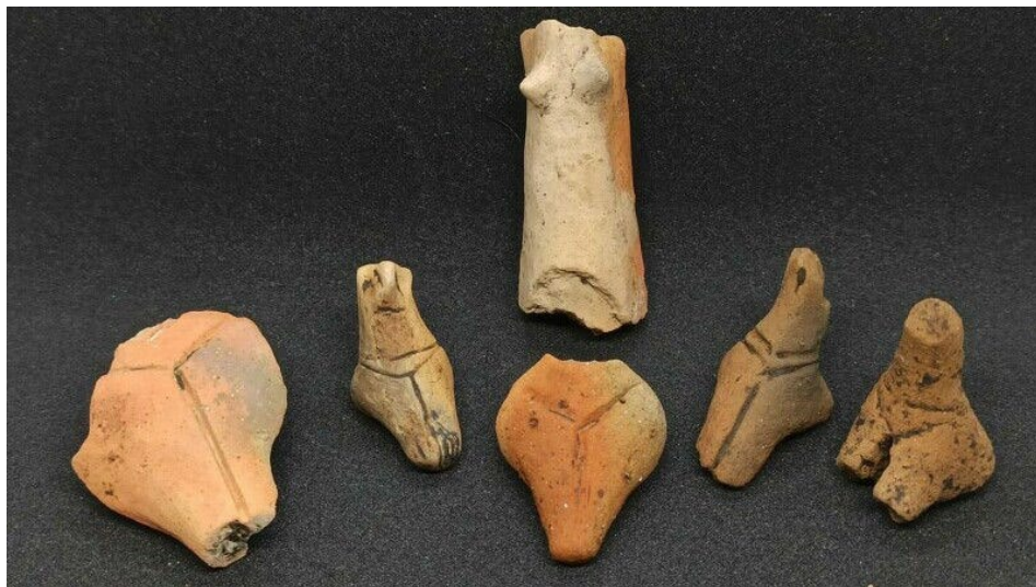
Fig. 2. Artefacte Precucuteni găsite la Topolița, jud. Neamț.

Culturii Ceramicii Liniare. În această campanie de săpături au fost identificate o serie de artefacte mai deosebite. Alături de arheologi au lucrat câteva echipe de tineri, studenți de la facultățile de istorie din București, Iași și Suceava, muncitori și voluntari, care au scos din pământul uscat mărturii importante ce atestă prezența unor comunități umane, de la care au rămas ruinele unor case incendiate.