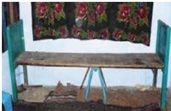
Fig. 7. Laviță cu capete înfundate, satul Găuzeni, raionul Șoldănești (reg. Iaiță). A aparținut Ceban Anastasia Ion (a.n. 1901). Dim: L=300; l=50; h=60/ h(speteaza)=110 cm Foto Madan Elena (2007)