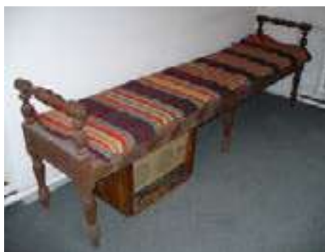
Fig. 8. Laviță cu capete strunjite (reg. Iaiță). Muzeul de istorie și etnografie, mun. Bălți Datarea sec. XX. Nr. inv. 18523 Dim: L=237; l=55; h =82 cm Foto Elena Madan (2009)

Apariția tăbliilor la pat se consideră că este de influență orășenească. Patul cu capetele înălțate prezintă variații a formelor, de la cele mai simple executate de însuși gospodar (fig.9), la forme mai rotunjite, cu treceri mai lente, cu variații a planurilor prelucrate de dulgheri și tâmplari cu instrumente specializate în cadrul atelierelor meșteșugărești (fig.10), până la cele mai complexe forme la care erau prezente elemente sculptate sau pictate (fig.11), care erau realizate de cele mai deseori în ateliere specializate din cadrul târgurilor, și care presupunem că se regăseau rareori chiar și la țăranii mai înstăriți.