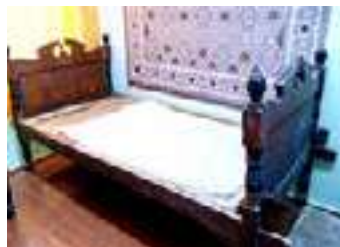
Fig. 11. Pat cumpărat la târgul din Staro-Cazaci, azi în Ucraina Muzeul de etnografie satul Crocmaz, raionul Ștefan-Vodă Proprietar Ganenco Moisei, Donat de feciorul Ionel (1989) Dim L=220; l=107; h=50/ h(capete)=110 cm; Datare 1938 Foto Bondari Aida (2020)