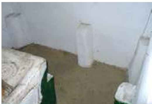
Fig. 1. Stâlpi suport pentru laviță, satul Tătăraști, raionul Strășeni Proprietar Șchiopu Ana (a.n. 1912), casa înc. sec.XX Foto Madan Elena (2008)