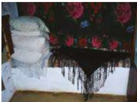
Fig. 2. Laviță de lut din satul Tătăraști, raionul Strășeni Proprietar Șchiopu Ana (a.n. 1912), Dim. L=264, l=55, h=50 cm (2008)