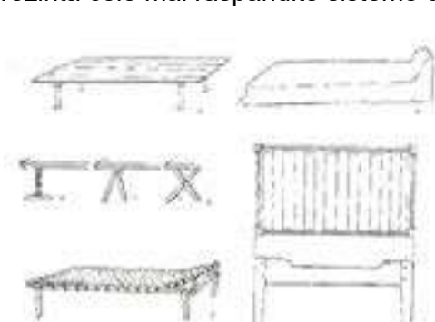
Fig.5. Sisteme de paturi: 1. Pat sau lavițe cu picioare înfipite în pământ, 2. Sisteme de susținere a lavițelor: a) picior sculptat, b) sistem de „capră”, c) picioare în formă de X. 3) Pat împletit, 4) Pat de pământ, 5) Pat construit în sistemul cunoscut sub denumirea „în pană și uluc” (Capesius 1974, 135)

La Roswith Capesius, sunt prezentate sisteme de paturi (Fig.5), acestea reprezintă cele mai răspândite sisteme de îmbinare la lavițe și paturi.