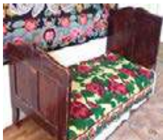
Fig.10. Pat executat de tâmplarul Ghelan Mitrofan Alexandru Muzeul de istorie "D. Cantemir", orașul Cantemir. Datare - prima jumătate a sec. XX. Foto Ghelan Alexandru (2020)