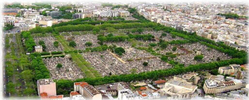
Fig.6 Cimitirul Montparnasse, Paris

Problemele actuale a cimitirelor. Amplasarea cimitirului depinde de mai mulți factori: relief, amplasare . Tipul cimitirului se află în raport direct cu perioada istorică de evoluție a localităților. Din această cauză cimitirele medievale diferă de cele moderne sau contemporane. Cele mai importante schimbări s-au efectuat în perioada de modernizare a societății, acest fenomen a progresat în statele europene și în SUA, unde alături de cimitirul tradițional apare cimitirul-grădină, perfect încadrat în planul urbanistic al localității. În spațiul european Cimitirul Montparnasse (Figura 6) sau cimitirul de Sud al Parisului a fost înființat la 24 iulie 1824. La început a fost localizat în afara orașului, astăzi fiind încorporat în partea centrală a orașului.