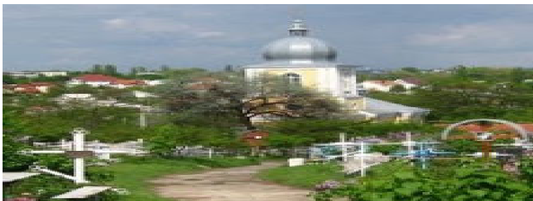
Fig.5 Cimitirul Buiucanii Vechi

Cimitirul Buiucanii Vechi a fost fondat la începutul secolului al XVII-XIX-lea și are o suprafață de 1,5 ha. Cimitirul este separat de străzile orașului de un gard metalic. Un avantaj incontestabil este amplasarea cimitirului în apropierea a două biserici celebre: Sf. Mucenic Valerius și Sf. Arhanghel Mihail. Figura 5.