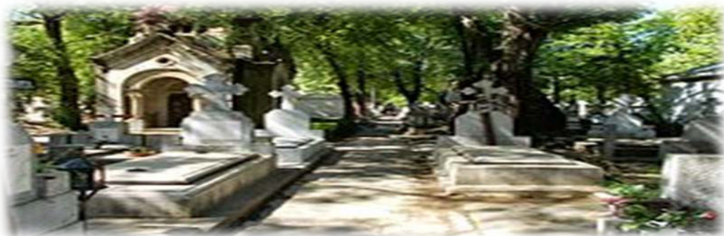
Fig.7 Cimitirul Bellu, București

peisaje culturale, cimitirele din mai multe localități din Republica Moldova au de parcurs o cale lungă de transformări, în primul rînd la nivel de mentalitate a societății. Ca exemplu putem menționa Cimitirul Bellu din București (Figura 7), care în cadrul congresului ASCE (Association of Significant Cemeteries in Europe) din 2010 a fost inclus în lista cimitirelor reprezentative pentru cultura și istoria europeană.