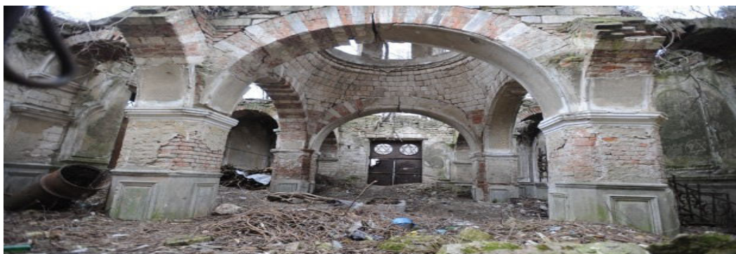
Fig.4 Capela din Cimitirul evreiesc

cimitirului este amplasată o sinagogă funebră, unica în Republica Moldova, la moment ruinată. Agencia de Inspectare și Restaurare a Monumentelor a evaluat starea cimitirului evreiesc ca fiind într-o stare avansată de degradare. Din păcate, timp de mai multe decenii, acesta a fost neglijat, transformându-se într-un spațiu năpădit de vegetație, cu morminte părăsite, lipsite de orice grijă și distruse, dar și cu numeroase construcții neautorizate amplasate în preajmă. Guvernul a elaborat un plan de acțiuni privind protejarea, conservarea și reabilitarea patrimoniului memorial al Cimitirului evreiesc din Chișinău. Prin Hotărârea de Guvern nr. 1019 din 17.10.2018, a fost înființată instituția publică „Muzeul de istorie al evreilor din Republica Moldova”. Funcția de fondator al instituției publice este exercitată, în numele statului, de către Ministerul Educației, Culturii și Cercetării. Figura 4.