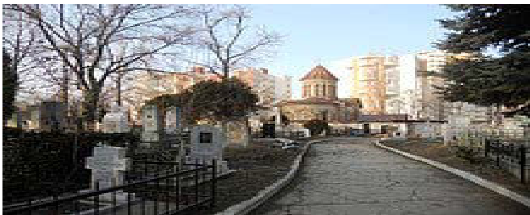
Fig.3 Cimitirul Catolic din Chișinău

Cimitirul catolic din Chișinău este fondat în anul 1822 și este considerat un monument de istorie și artă de categorie națională, înscris în Registrul monumentelor din Republica Moldova, fiind amplasat pe strada Valea Trandafirilor. Are o suprafață de 1,9 ha. Aici sunt amplasate două cimitire: armenesc-gregorian, cu paraclisul Capela Învierea Mântuitorului și cel romano-catolic polonez, cu paraclisul Capela Oganowici . Înainte de apariția mormintelor, pe teritoriul cimitirelor se afla un azil pentru bătrâni și o grădin. Arhitectul Ozmidov a fost responsabil pentru planificarea cimitirului catolic. La sfârșitul anilor 1940, cimitirul este modificat în cimitir obișnuit orașenesc iar în anul 1960, o parte din morminte sunt distruse pentru ca terenul curățit să fie folosit pentru alte morminte. În prezent nu au loc înhumări în cimitirul catolic. Figura 3.