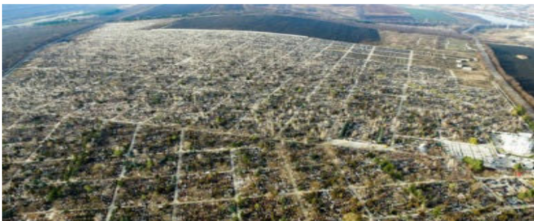
Fig.2 Cimitirul "Sfântul Lazăr", Chișinău

Cimitirul Sfântul Lazăr are o suprafață de 200 ha și este considerat unul dintre cele mai mari cimitire din Europa . Cimitirul a fost înființat în anul 1966 și în prezent are peste 300.000 de morminte, printre care și 600 de cavouri , fiind împărțit în 266 de sectoare. O parte din cimitir aparține guvernului Germaniei și găzduiește rămășițele soldaților germani căzuți în cel de-al Doilea Război Mondial . Către mijlocul anului 2015 administrația cimitirului a solicitat autorităților municipale și primăriei satului Grătiești să permită extinderea cimitirului cu încă 50 de hectare . Figura 2.