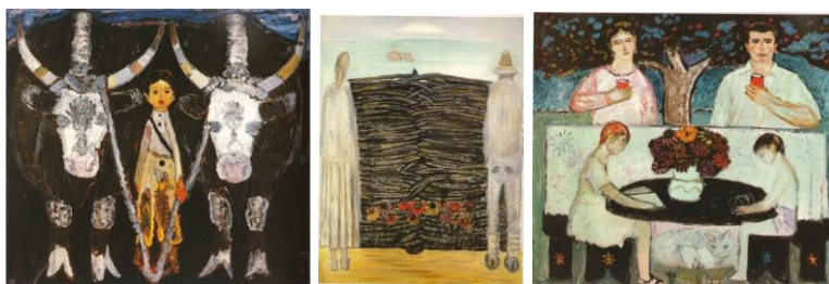
Fig.2 a, b, c. Grecu Mihai „ Istoria unei vieți”, 1967, u/p Galeria „Tretiakov” Moscova.

Privind integral compoziția „Istoria unei vieți” (fig. 2 a,b,c), rămânem surprinși de strategia organizatorică a structurii compoziționale, în care figurativul leagă narațiunea sau continuitatea gândului într-un mod bizar, la prima vedere, dar concis și semnificativ la o privire mai aprofundată. În aciaastă istorie ne inițiază figura băiețașului, ce transnitate prin chipul și înfățișarea sa, trăiri cutremurător de veridice ușor reconoscibile, care trezesc în subconștientul privitorului, segvențe