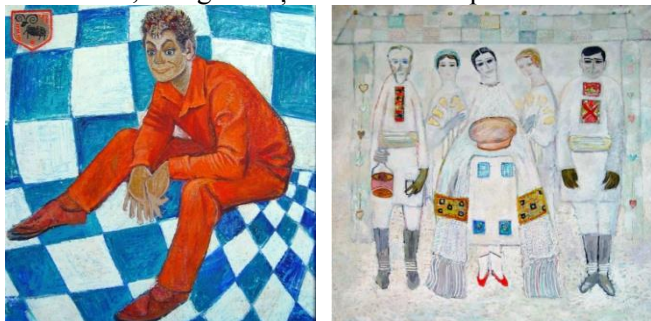
Fig. 3. Rusu-Ciobanu Valentina, „Portretul regizorului Emil Loteanu”, 1967, u/p., 118x113 cm., MNAM.

Novăția plastică pătrunde și remodelează genul portretului optând spre depășirea „scopurilor portretistice propriuzise” și căutarea procedelor de „tipizare a imaginii prin compoziții unificative” reprezentative (Tona L., 1983, p. 102). Scopul implementărilor plastice fiind concentrat pe valorificarea calităților forte ale personajului. Un experiment neordinar și novator în acest sens în descrie tabloul „Emil Loteanu” (1967) (fig. 3) de V. Rusu-Ciobanu, prezentat la expoziția unională închinată celor „50 de ani de la Revoluția din octombrie”. În abordarea plastică artista crează o simbioză între pictura naivă și cea „fauvistă” (Ciobanu C.I., p. 32), asociate într-o stilizare șarjată aluzivă la tipologia caracteristică a figurii, sugerând un portret senzorial al creatorului și al creației sale. Caracterul estetic al figurativului tinde la o expresivitate expansivă ușor irascibilă, subliniată semnificativ și prin caracterul vestimentar (costumul roșu „incendiar”), care pretinde la o metaforizare a universului creativ al personajului, cu afecțiunea spirituală plină de dramatism, energitism și vivacitate temperamentală.