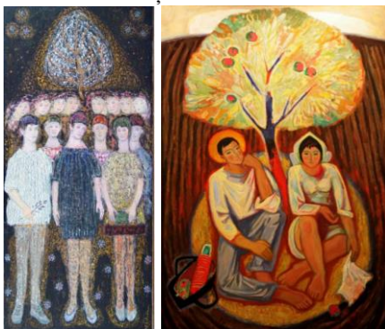
Fig.5 Zevin Ada, „Gaudeamus”, 19680, u/p., 150x66 cm., MNAM.

metaforică a chipurilor populare cu calități extrem de blajine, primitive, naive și credibile, unde intenția de caricaturizare a portretelor, sugerează o replică critică a loialității nelimitate a mediului social tradițional.