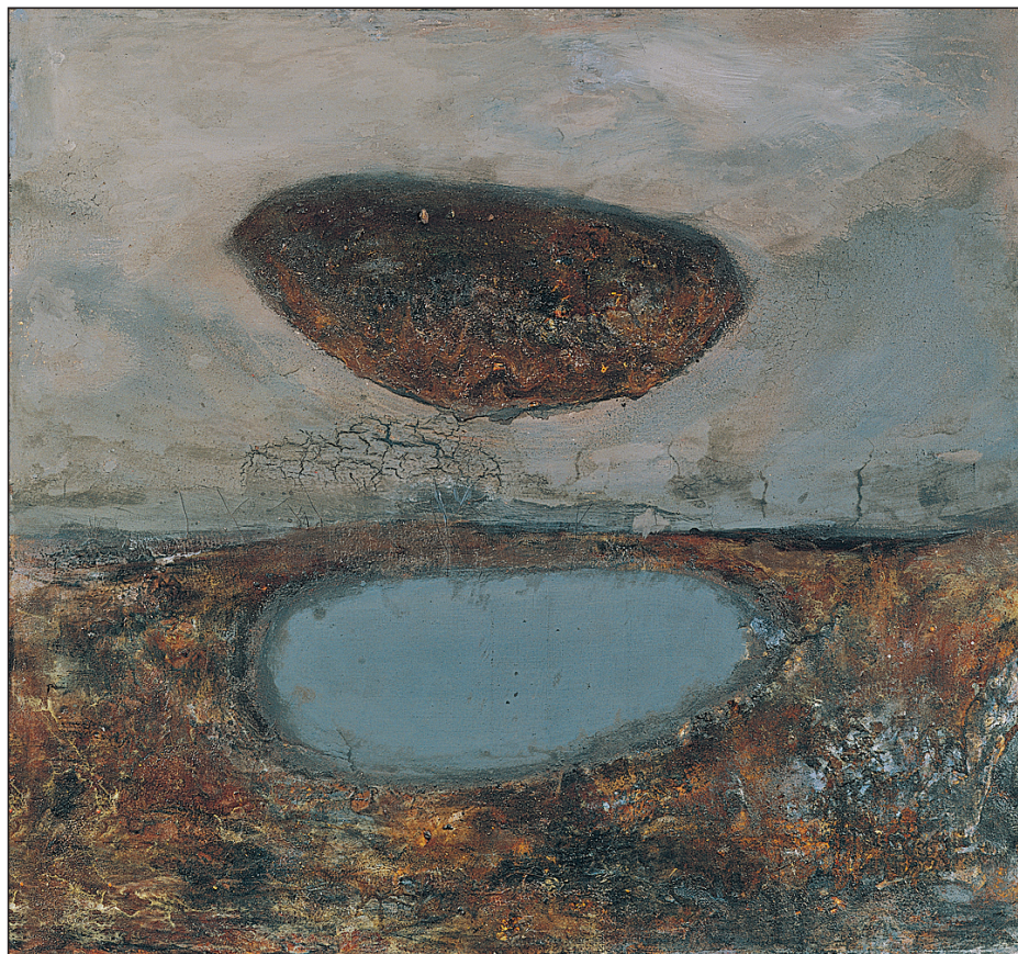
Mihail Grecu. Fantastic . 1977, pânză, tehnică mixtă, 95 × 100 cm